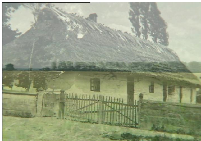
Obrázok 4: Pôvodný dom v obci Sliepkovce