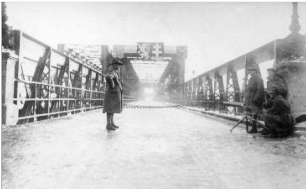
Legionárska stráž na moste cez Dunaj.

Prešporok a okolie. Boli v nej viaceré známe osobnosti a predsedal im Ferdiš Juriga 3 . V obciach organizovali národné rady a zavádzali v nich takzvanú obrannú stráž. Sídliť v župnom dome a očakávali od nej spoluprácu s Budapešťou. Jej činnosť v meste i na okolí sa však rýchlo dostala do podozrenia a jej zástupcovia boli predvolaní k vládnemu komisárovi. Š. Krčméry zaznamenal: „vyslali sme k nim delegáciu. Rečníkom bol Juriga. Tentoraz hovoril stručne, pokojne, ale jeho slová pôsobili ako hrom. Prvá veta bola otázka: Či sú páni povedomí toho, že stoja na pôde československej republiky? – Bolo to vtedy ukrutné pre vážnych pánov otcov vlasti, ale bolo jasné. Odvtedy Bratislava vrela a vytrval v nej bolo čoraz nebezpečnejšie... Fanatickí študenti striehli ma po večierkoch“ (Krčméry, 1931: 71).