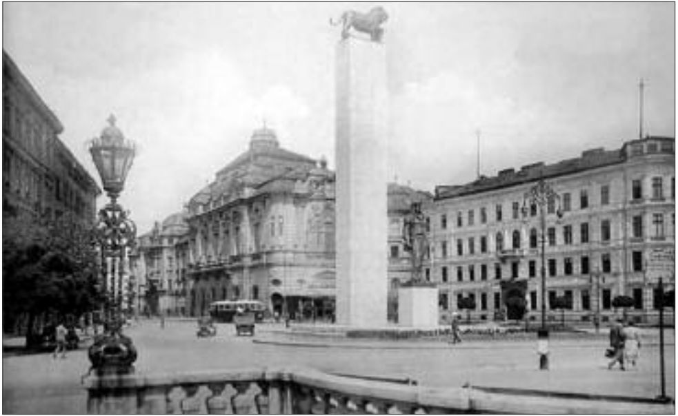
Pamätník M. R. Štefánika na dnešnom Štúrovom námestí v Bratislave.