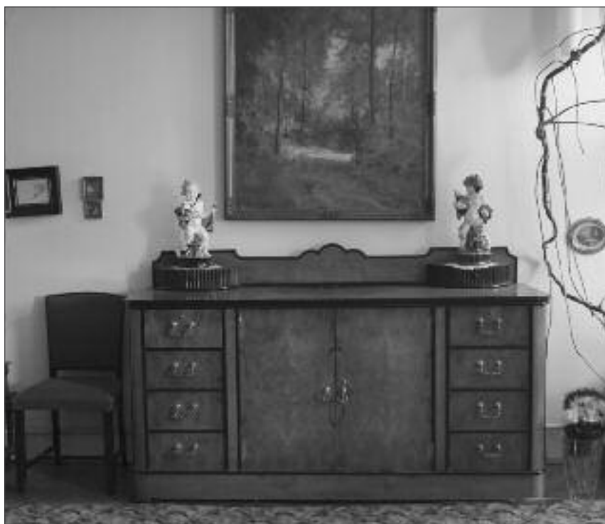
Nábytek z Bratislavy v brněnském bytě, 2018.