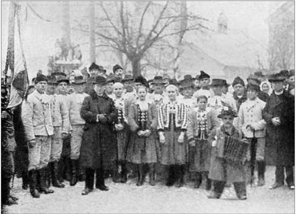
Slávnostné dni v Bratislave 4. – 5. februára 1919, hostia z okolia Malaciek.

Nariadenie ministra národnej obrany V. Klofáča znamenalo nielen ďalší vývoj mesta, ale celého Slovenska: „Neblahé zkušenosti posledních dnů na Slovensku a zvláště případ přešpurský (slavnostní vjezd zemské vlády na Slovensku dra. Šrobára do Prešpurku byl zmařen passivní resistencí a stávkou maďarských úředníků a zřízenců ponechaných prozatím ve službě Československé republiky) vyžadují bezodkladné vyměnění veškerých maďarských důstojníků, úředníků a vojnů dosud v našich službách ponechaných“ (Bratislava, 1977: 254).