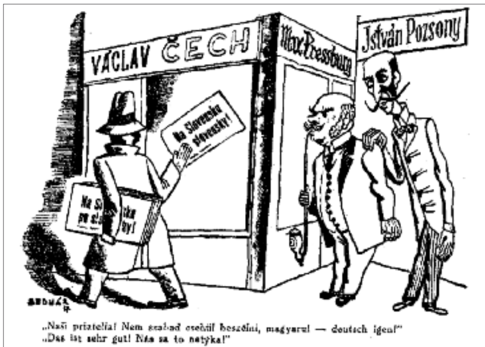
Karikatúra k jazykovej politike v Bratislave z roku 1937.