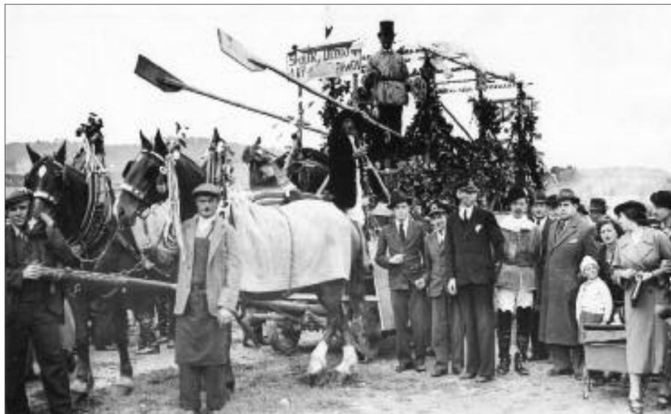
Dunajské slávnosti v roku 1923.

V miestnych pomeroch a medzietnických vzťahoch bolo potrebné československú štátnu ideu neustále presadzovať a potvrdzovať. Na politických, kultúrnych a spoločenských podujatiach sa snažili predstavovať ako komunita, ktorá má nielen spoločné ciele, ale rešpektuje aj spoločnú národnú identitu. Istotne v tom zohrávalo dôležitú úlohu ich menšinové postavenie v meste.