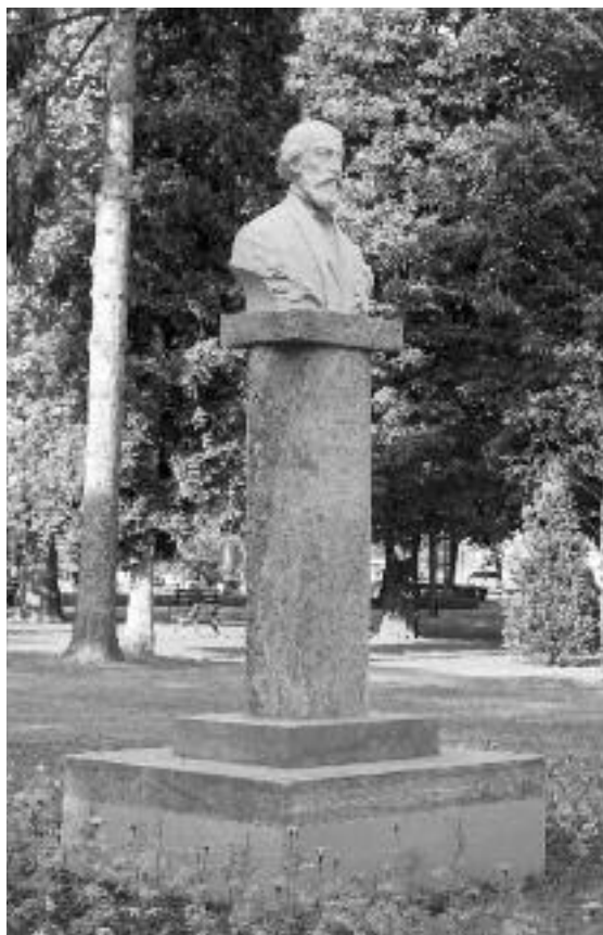
Hurbanov pomník v Novom Meste nad Váhom – súčasný stav.