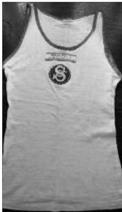
Sokolské tričko Viktora Sedláka ml., konec dvacátých let 20. století.