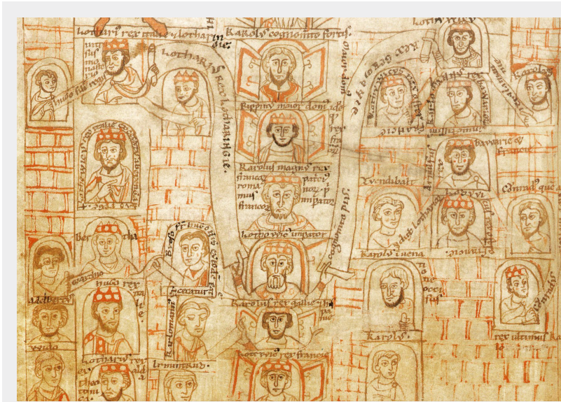
Figure 1: 12th-century family tree of the Carolingians. Staatsbibliothek zu Berlin Ms. lat. fol. 295 80v.

Beate Kellner 7 proposed the idea of genealogical awareness ( genealogisches Wissen ) stating that genealogic thinking in the Middle Ages was one of the earliest attempts to create a learning system and one of the earliest forms of understanding the world, and that genealogy was a dominant mental structure. Family and kinship were seen as the most important form of medieval people's consociation. The most striking examples of this thinking can be found in Petrus Pictaviensis' Compendium historiae in genealogia Christi (1130 – 1205), which served as a model for genealogical textbooks. Among the most influential points of references to dynasties, she quotes the Bible, Troy, Rome, and Melusine. Genealogical thinking and its use in medieval historical narrative was a topic of several inspiring papers written by Gabrielle Spiegel, too. 8