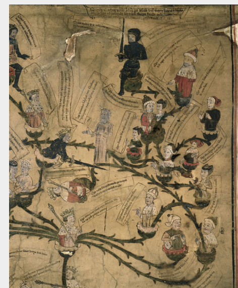
Figure 3: Genealogy of Edward IV (British Library, Harley 7353)

Previous scholarship repeatedly stressed the importance of the late 13th and early 14th century when the Habsburgs acquired a royal status and, unlike the neighbouring dynasties, continued to rule for many centuries to come. 31 Another decisive phase came in the 15th and early 16th century, when a functional system of marriage connections and inheritance treaties gave the dynasty one ruling title after another, without having to fight for it much. As a matter of fact, the Habsburgs came