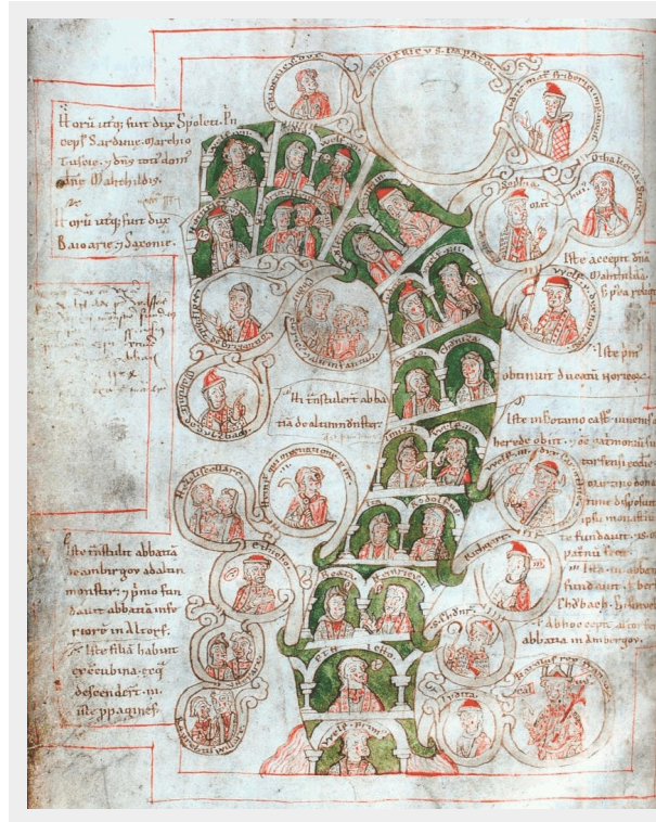
Figure 2: Genealogia Welforum. Hessische Landesbibliothek, Fulda, ms. D.11 folio 13v.

term with no medieval counterpart, a category that brings together works that medieval people would have seen as related; she also mentions other forms of dynastic history, such as family trees (from the 12th century) and family necropolises from the 13th century onwards. Very debatable is her statement on Frutolf, when labelling his history as regnal, as